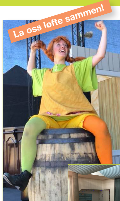
Alle bildene er fra ègal teater.

Vi har nå sendt ut fakturaer – denne kontingenten bidrar til å støtte opp gode aktiviteter i NFKUT, blant annet et flott årsmøte hvor vi ønsker å legge planer sammen med medlemmene for fremtidige behov og aktiviteter for foreningen.